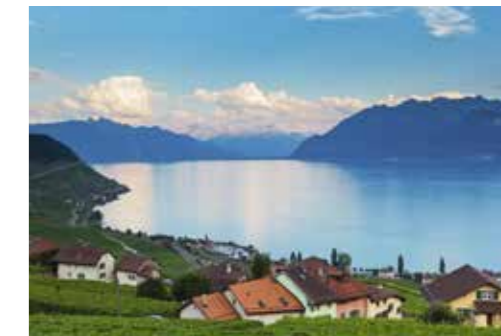
▶ Le lac Léman