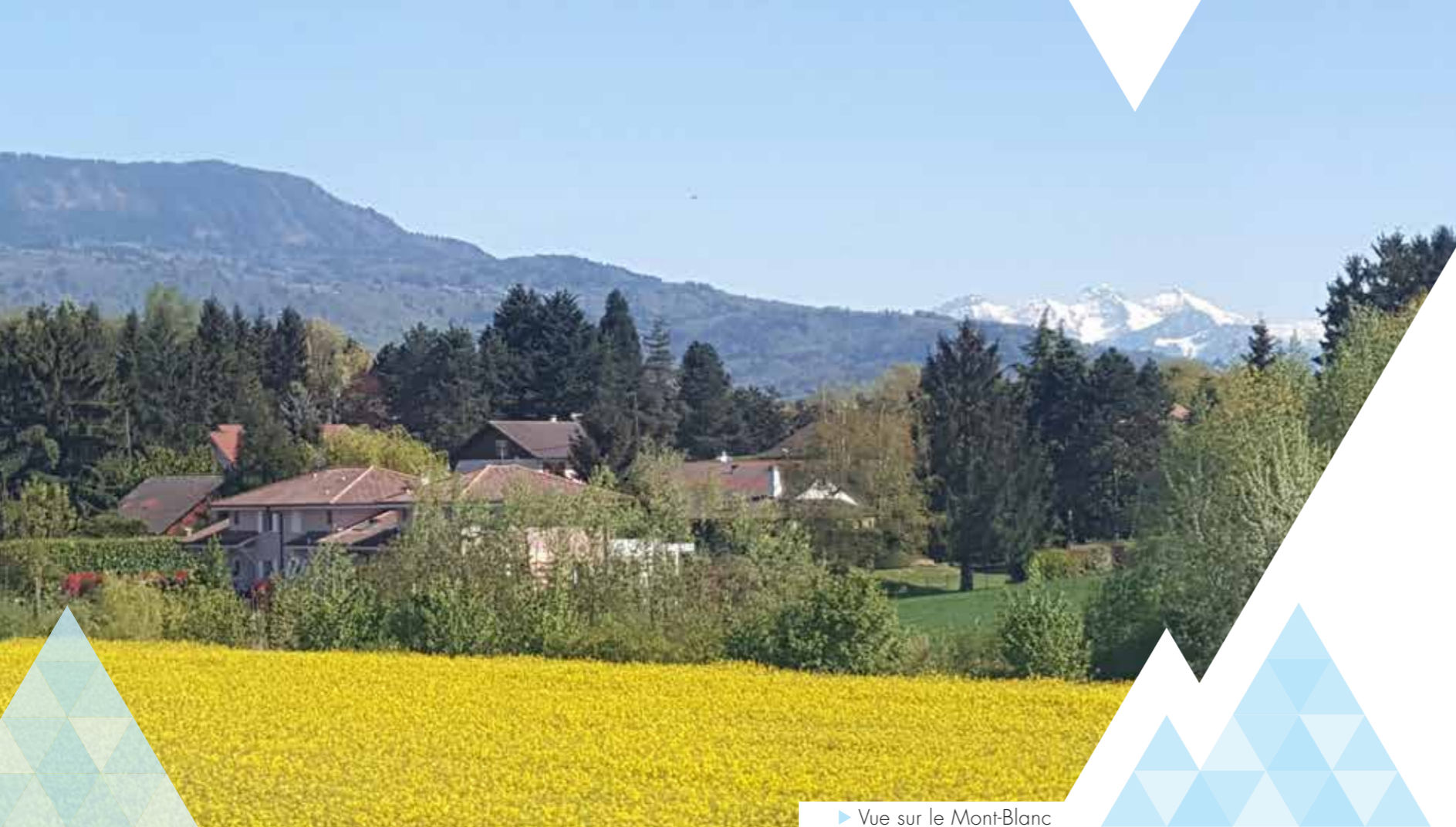
▶ Vue sur le Mont-Blanc