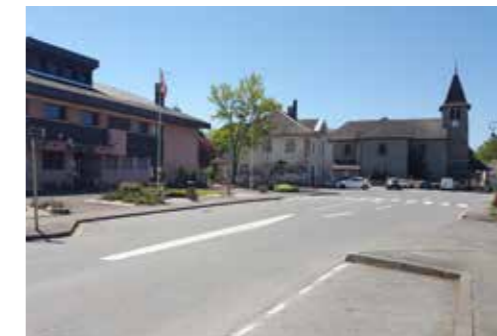
▶ La mairie et l'église

Et vivre à Veigy-Foncenex c'est aussi et surtout profiter de l'attractivité économique et culturelle de Genève , Thonon-les-Bains ou Annemasse , à quelques encablures seulement. Au quotidien, la commune propose pour le bien-être de ses habitants, un supermarché, des commerces de proximité, des écoles, une médiathèque et des équipements sportifs de qualité.