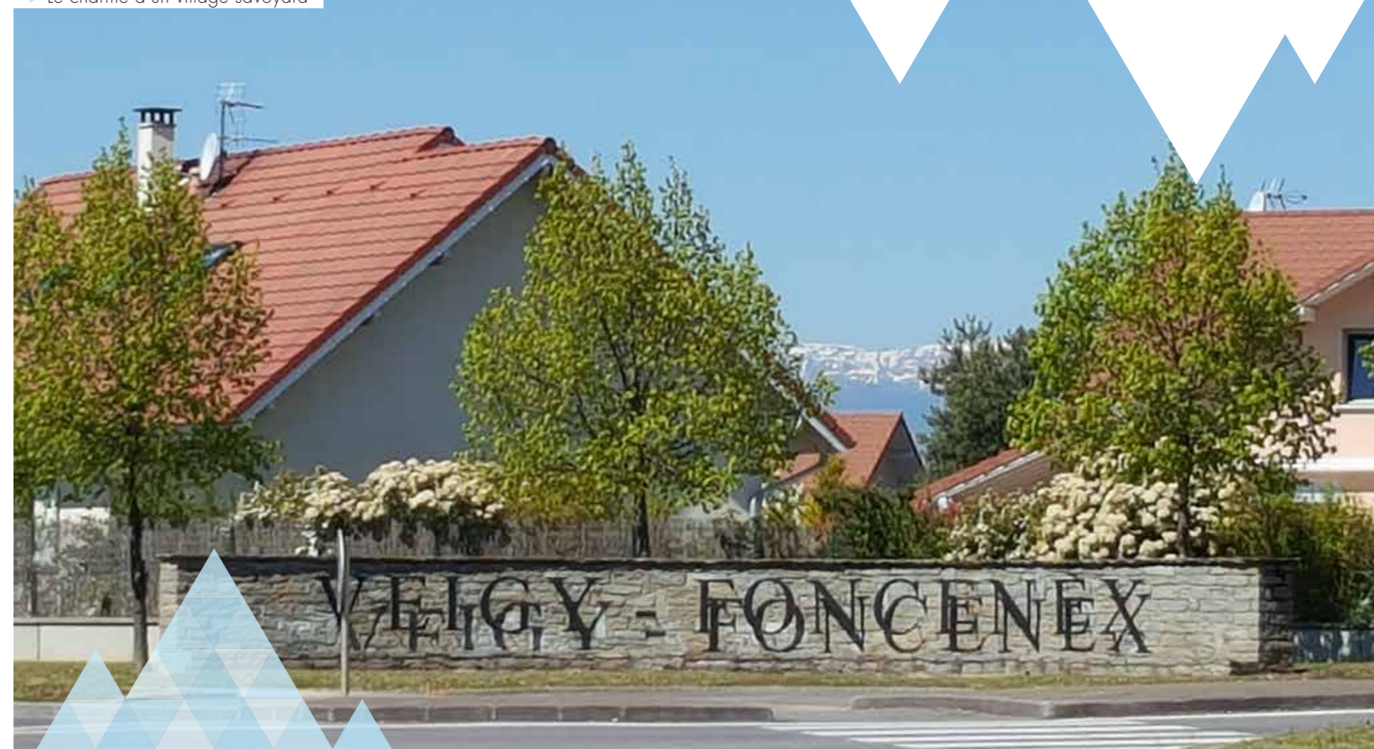
▶ Le charme d'un village savoyard